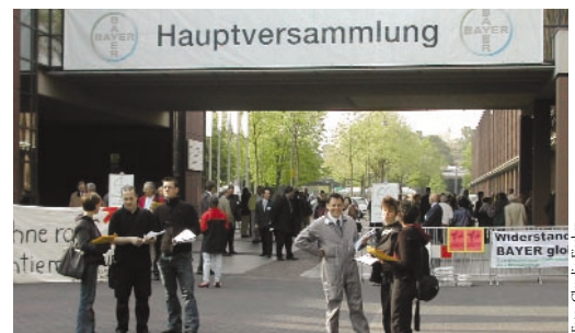
Wenn Bayer nicht zum BigBrotherAward kommt, kommen wir zu Bayer

Mit kritischen Aktionären und kritischen Datenschützern gleichermaßen war die Bayer AG auf ihrer Aktionärsversammlung im April 2003 konfrontiert. Der FoeBuD überreichte auf der ordentlichen Hauptversammlung in Köln den BigBrother Award von Oktober 2002. Da der Chemie- und Pharmakonzern im Gegensatz zu Microsoft zuvor nicht reagiert hatte, erfolgte die Übergabe des Awards statt auf der BBA-Gala nun vor etwa 3.000 Aktionären. Bayer erhielt den Negativpreis in der Kategorie „Arbeitswelt“ für Urintests bei Auszubildenden. Die Jury des BigBrotherAwards bezeichnete das Drogen-Screening als „entwürdigende Praxis, die Arbeitnehmer unter Generalverdacht“ stelle. „Misstrauen