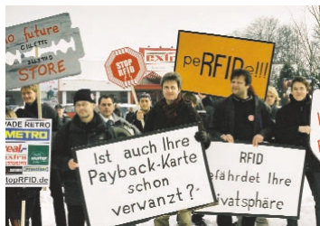
Datenschutz-Demonstration des FoeBuD vor dem Extra Future Store in Rheinberg

veröffentlichte den Fall. Die Financial Times Deutschland berichtete, der Börsenkurs der Metro AG sank. Der FoeBuD rief zu einer Demonstration vor dem Future Store in Rheinberg auf. Die Metro machte einen Rückzieher und tauschte rund 10.000 bereits ausgegebene Karten in Plastikkarten ohne Chip um.