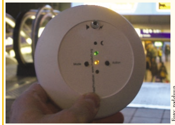
Der DataPrivatizer unterwegs

Nach dem RFID-Scanner-Detektor-Armreif, der seit Anfang des Jahres im FoeBuD-Shop erhältlich ist, wird jetzt auch der DataPrivatizer angeboten. Einen Prototypen konnte der FoeBuD Anfang Februar auf dem Festival „Transmediale“ in Berlin vorstellen. Der DataPrivatizer zielt in die gleiche Richtung wie der Armreif, kann aber viel mehr: Er spürt RFID-Lesegeräte und RFID-Etiketten auf. Die Etiketten können ausgelesen, gespeichert – und neu beschrieben werden. Das findige Gerät mit dem Aussehen einer fliegenden Untertasse hat das FoeBuD-Team gemeinsam mit den Hardware-Spezialisten von Klatho aus Hamburg konstruiert. Das „Privacy Gadget“ konnte dank der finanziellen Förderung der Stiftung „bridge“ realisiert werden. Der DataPrivatizer wird über den FoeBuD-Shop vertrieben.