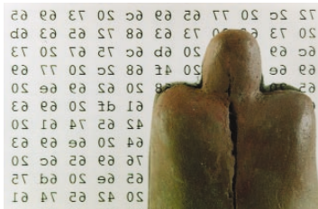
Die BigBrotherAwards Preisstatue

Die französische Zeitung Le Monde nennt sie respektvoll die „Oscars für Überwachung“, von den Preisverleihungen berichten inzwischen viele überregionale Medien und manchmal kommt sogar ein „unglücklicher Gewinner“, um einen der „Negativ-Preise für Datenkraken“ persönlich entgegenzunehmen. Die 1998 initiierten BigBrotherAwards haben inzwischen international einen guten Ruf als wirkungsvolles Instrument gegen Datenmissbrauch. In Deutschland verleihen wir die Auszeichnungen seit 2000 einmal jährlich an Unternehmen, Organisationen und Politiker, die nach Meinung der Jury erheblich die Privatsphäre der Bundesbürger verletzen. Vergaben werden die Awards in verschiedenen Kategorien, darunter „Politik“, „Verbraucherschutz“, „Arbeitswelt“ und „Kommunikation“.