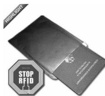
3Ein der Renner im FoeBuD-Shop: Die ePass-Schutzhülle