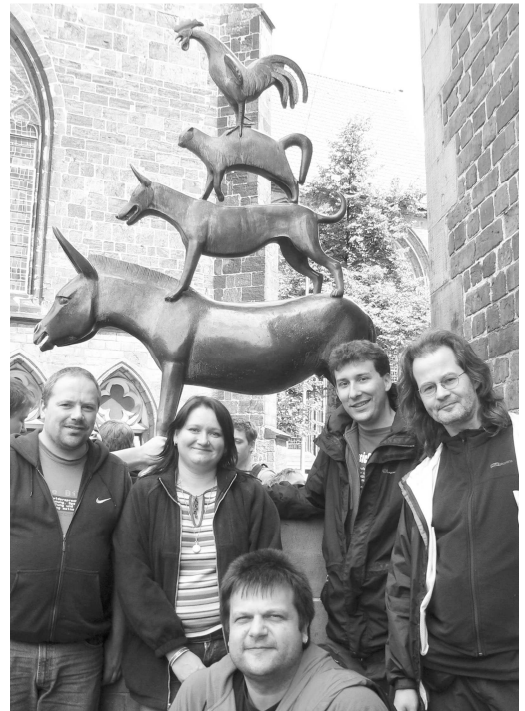
7"Eine bessere Welt finden wir überall" - FoeBuD-Wochenende in Bremen