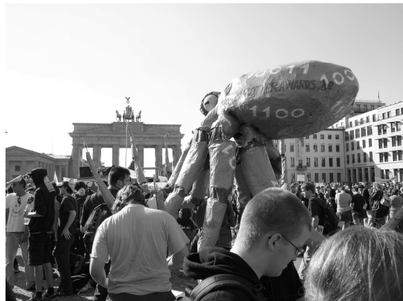
2Viel beachtet: Der große Datenkrake des FoeBuD

"Das ist die größte Demonstration für Bürgerrechte und Datenschutz seit der Volkszählung 1987", sagte der Datenschutzbeauftragte von Schleswig-Holstein, Thilo Weichert, gegenüber tagesschau.de.